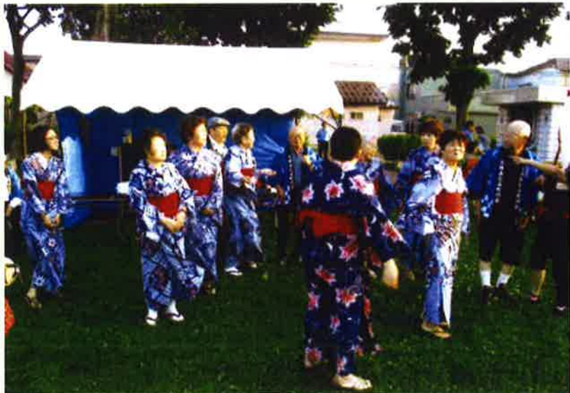
町内会夏まつりに参加