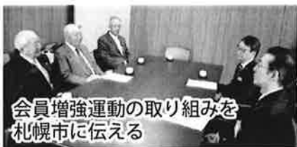
会員増強運動の取り組みを札幌市に伝える