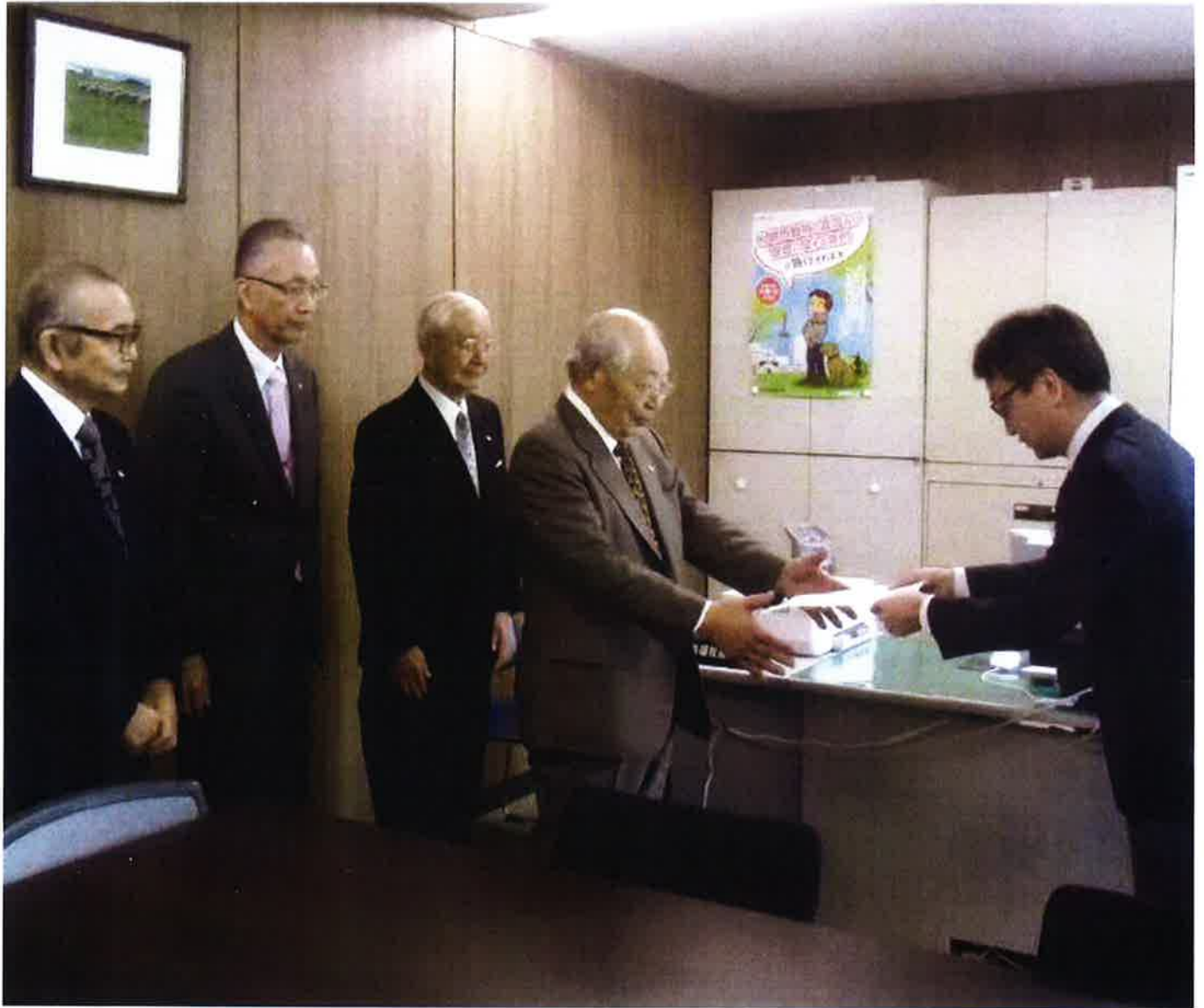
老人クラブ補助金拡大要望書に対する回答書の手交式（平成30年2月8日）

制作・印刷 株式会社 ニチコミ 電話 03-5718-3900 http://www.nichicomi.com